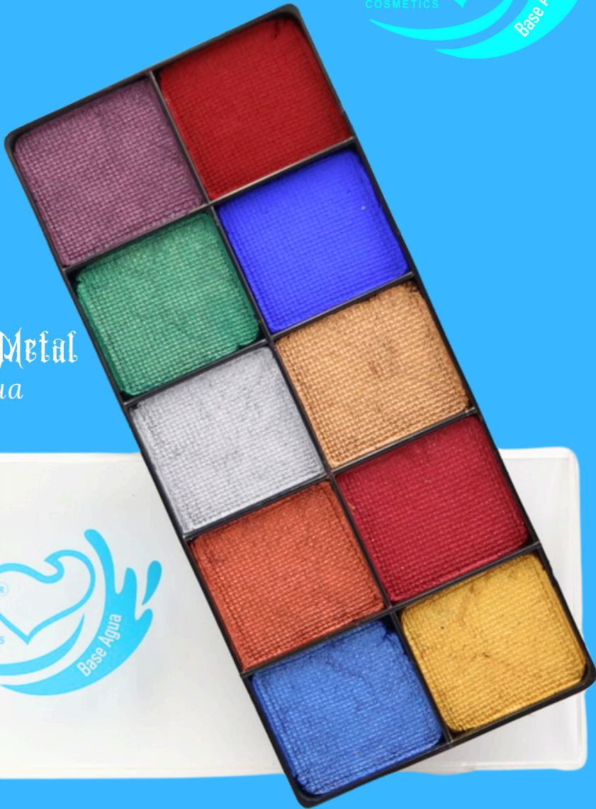
Paleta Metal Base Agua 300 g.